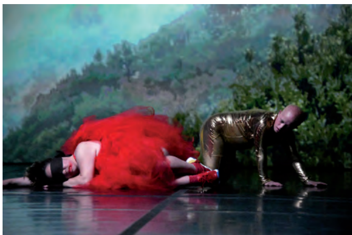
7. Happy Island , 2018, La Ribot_Dançando com a Diferença.