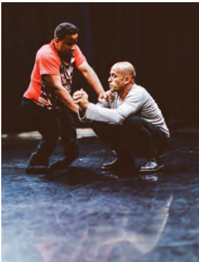
7. Ma vie sans bal , Eric Langlet