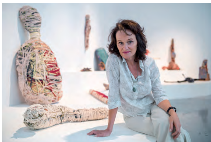
12. Lucienne Peiry