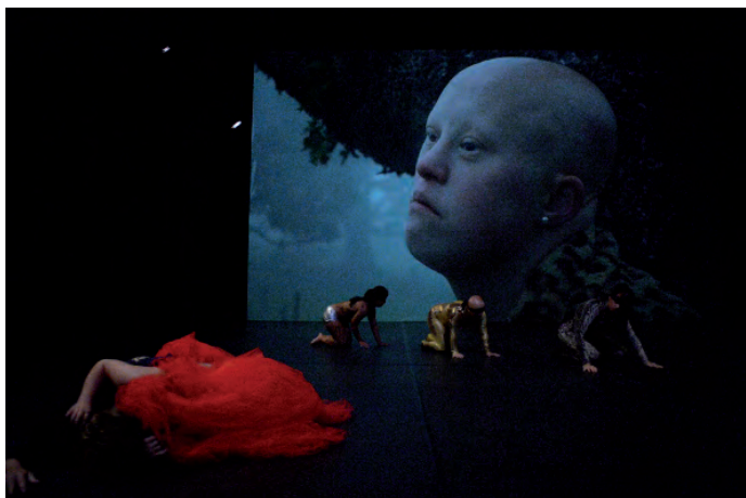
7. Happy Island , 2018, La Ribot_Dançando com a Diferença.