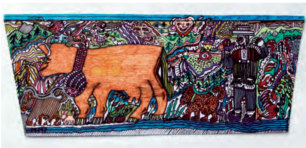
7. Monique Mercerat, Poya