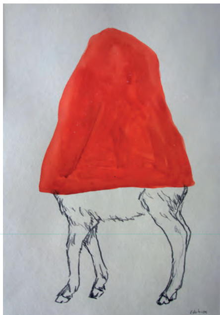
7. Edi Dubien, Tentative pour un nouveau monde 1 , 2019