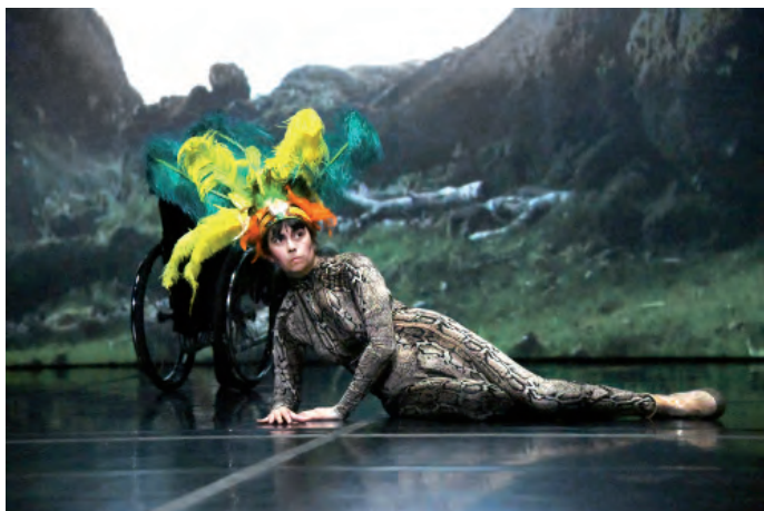
7. Happy Island , 2018, La Ribot_Dançando com a Diferença.

Un partenariat entre Out of the Box et IntegrART, un projet de réseau du Pour-cent culturel Migros