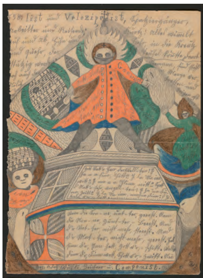
12. Adolf Wölfli, Sans titre , 1909 Collection de l'Art Brut, Lausanne