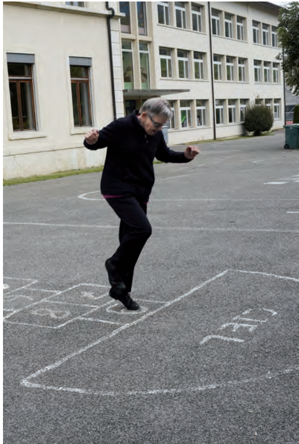
7. Monique Mercerat