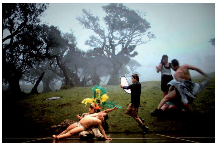
7. Happy Island , 2018, La Ribot_Dançando com a Diferença.