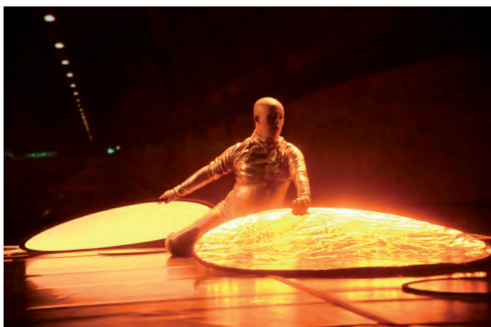
7. Happy Island , 2018, La Ribot_Dançando com a Diferença.