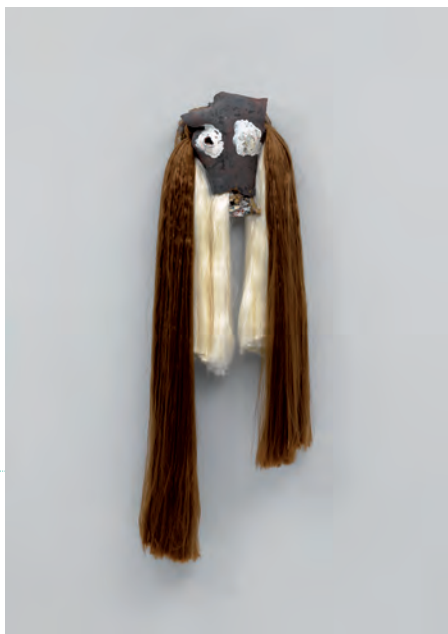
7. Sylvie Auvray, Masque 3 , 2015 Collection FCAC