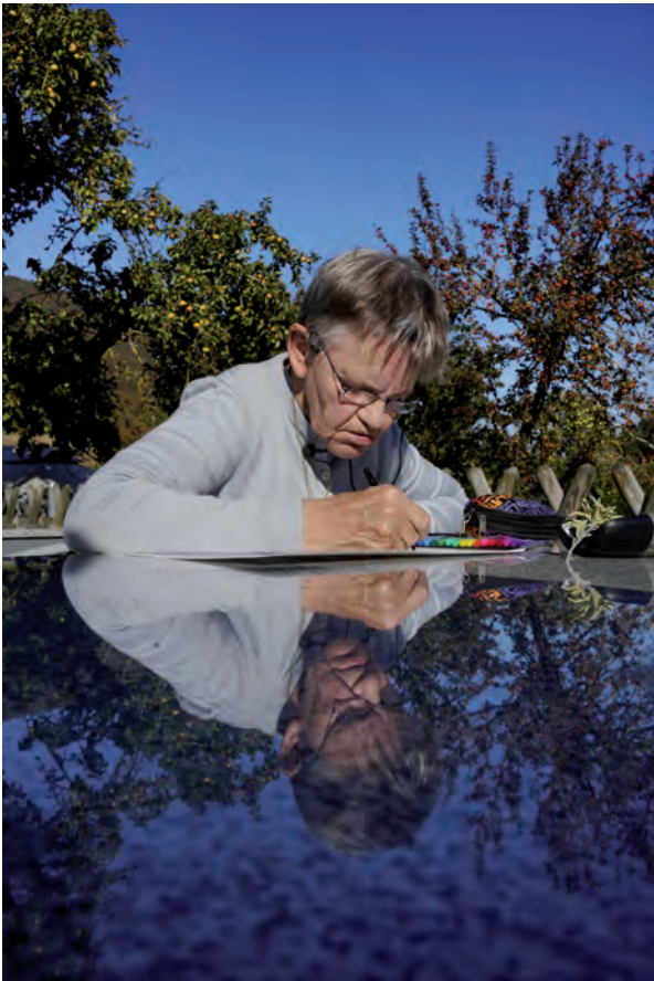
7. Monique Mercerat