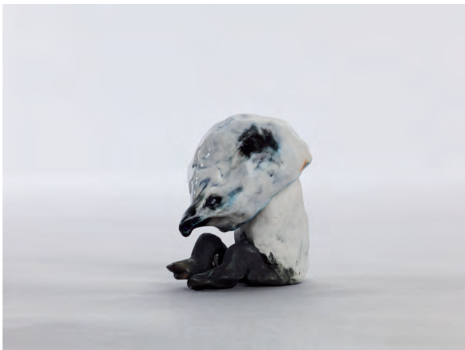
7. Keiko Machida, Oiseau bleu (série micro-narratives) , 2011, 2011 Collection FCAC