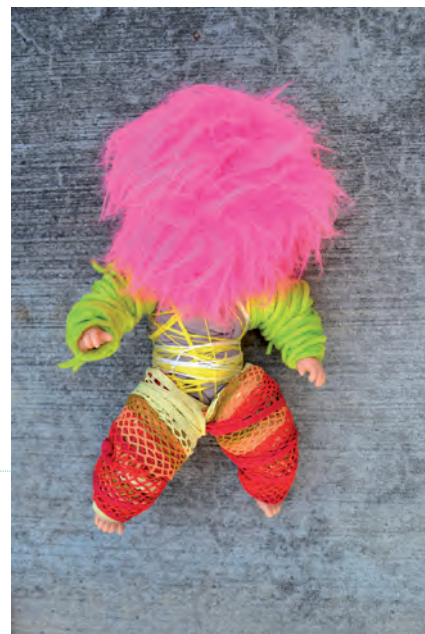
7. Sabrina Renlund, Poli-Alien 1 , 2016