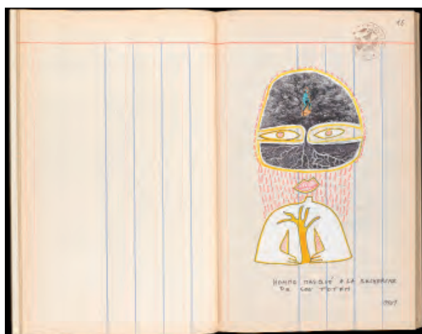
12. Marcel Miracle © Fondation Martin Bodmer, Naomi Wenger