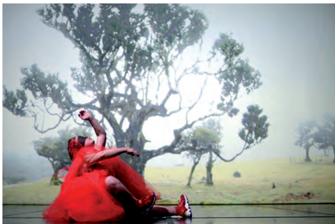
7. Happy Island , 2018, La Ribot_Dançando com a Diferença.