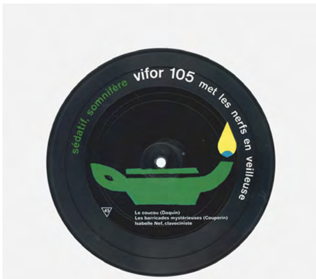
23. Francis Baudevin, ST, 2002. Ensemble de six photographies, 28 x 28 cm