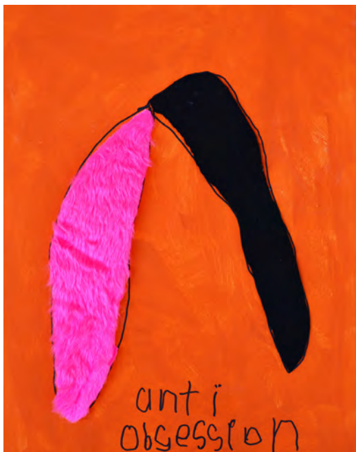
19. Sabrina Renlund, Anti-Obsession, 2017. Technique mixte, 50 x 40 cm