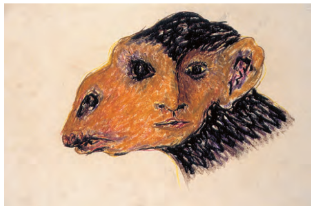
14. Etienne Descloux, Animae, 1992. Pastel sur papier, 29,5 x 44 cm