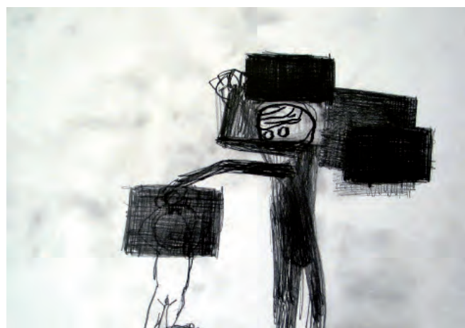
18. Miriam Cahn, Zensur, 2007. Crayon sur papier, 21 x 30 cm