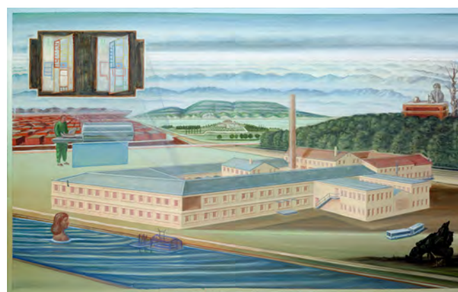
16. Philippe Fretz, Kugler 360°, 2010. Huile sur toile