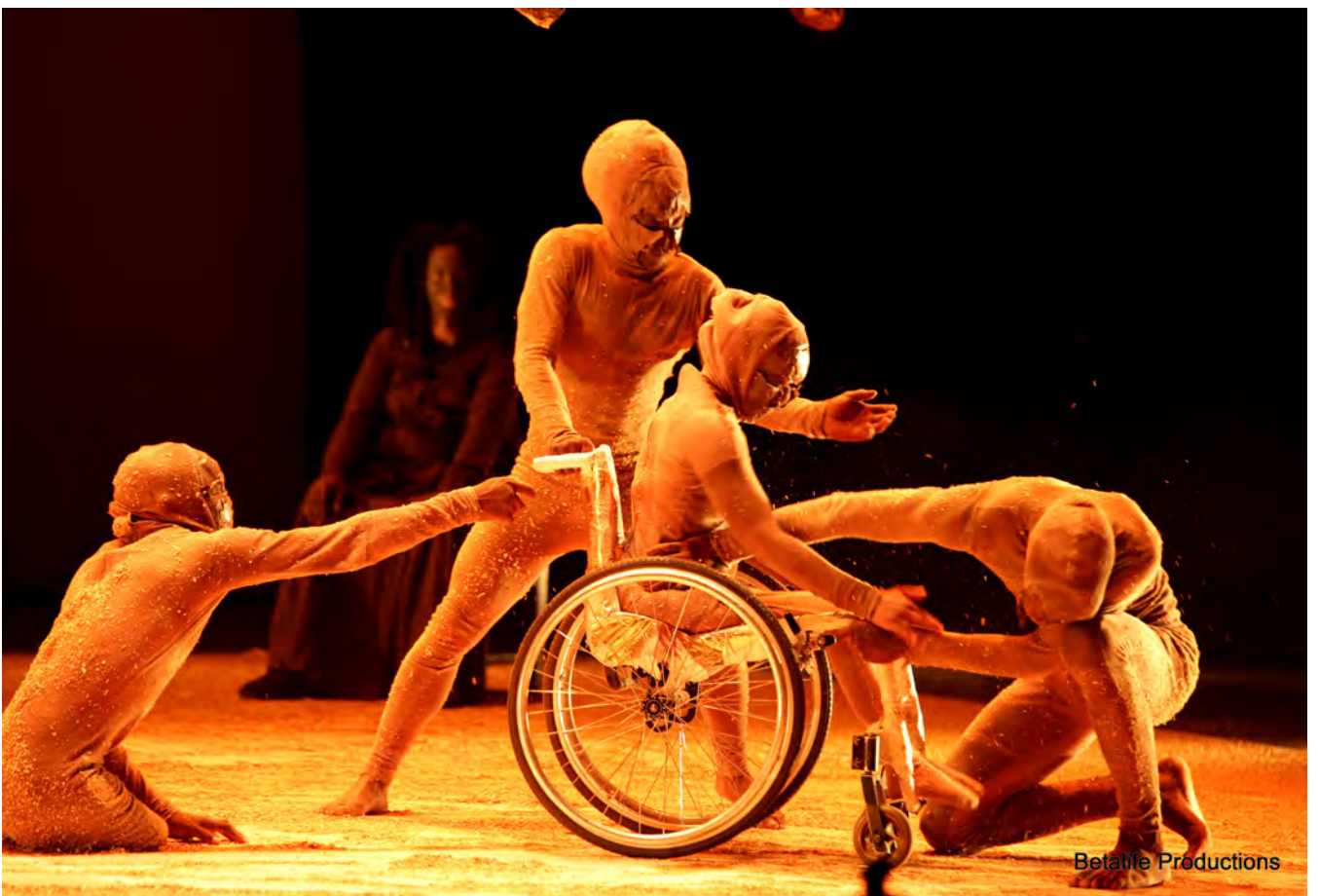
6. Ashed, Unmute Dance Companie