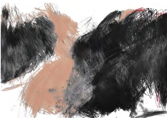
17. Coralie Riat, Sans titre, 2016. Crayon gris et pastel sur papier, 63 x 44 cm