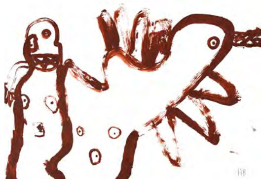
13. Alexandre Baumgartner, L'homme et l'oiseau, 2017. Acrylique sur papier, 42 x 55 cm