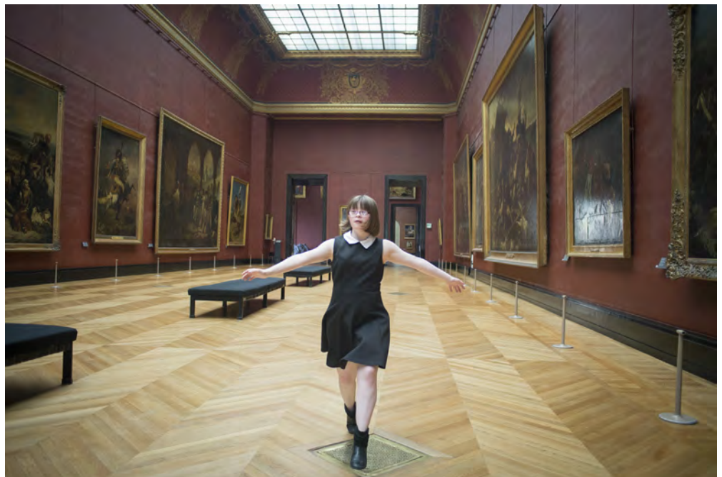
La Visite, Le Louvre. SaNoSi-Productions Elodie Perriot

L'audiodescription est un procédé qui permet de rendre des films accessibles aux personnes aveugles ou malvoyantes grâce à un texte en voix off qui décrit les éléments purement visuels (action, mouvements, expressions, décors, costumes, etc.). La voix de la description est placée entre les dialogues ou les éléments sonores importants afin de ne pas nuire à l'œuvre originale.