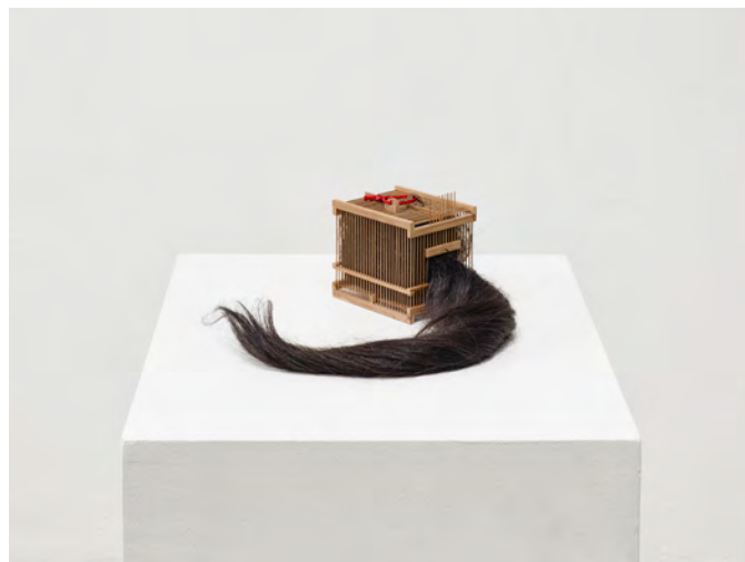
20. Yuki Shiraishi, Gué Gué Gué, 2014 Cage d'insecte japonaise en bambou, cheveux, éponge, tissu 10 x 8 x 12 cm