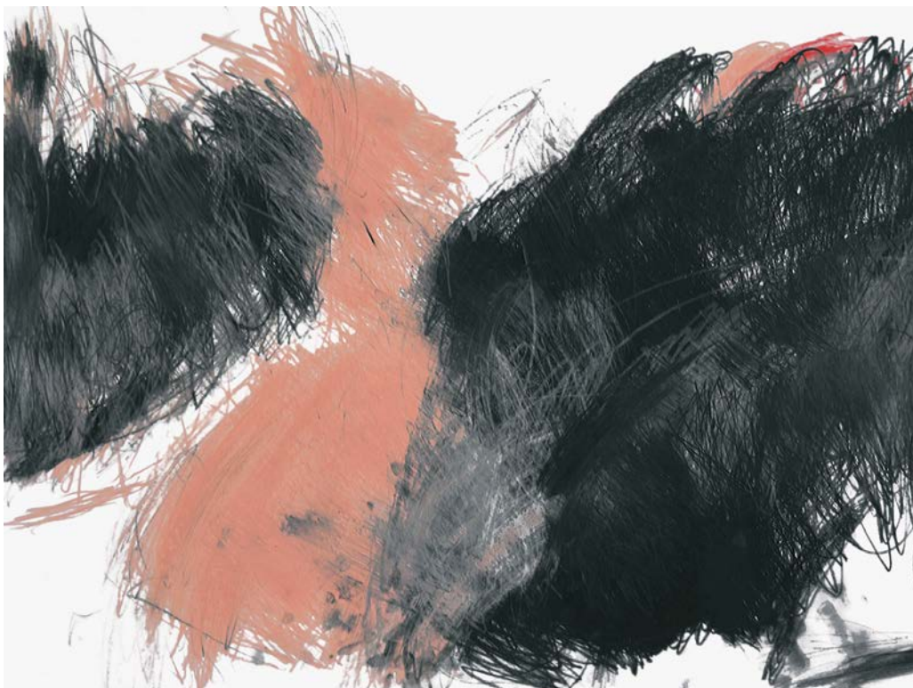
Ci-contre: Coralie Riat, Sans titre, 2016. Crayon gris et pastel sur papier, 63 x 44 cm ● Miriam Cahn, Zensur, 2007. Crayon sur papier, 21 x 30 cm